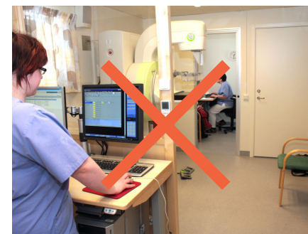
Ojämn könsfördelning och bristande mångfald.