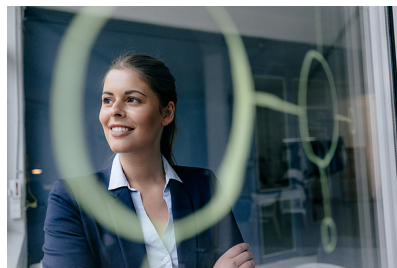
Fotograferat genom glas